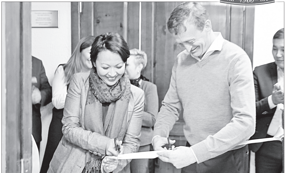
На открытии специализированной аудиторией ТОО «Компания Нефтехим LTD»

Материально-техническая платформа ПГУ постоянно модернизируется. Созданы четыре новых лаборатории, которые оснащены 61 единицей оборудования. В настоящее время университет проводит процесс аккредитации этих лабораторий. Дополнительно Павлодарский нефтехимический завод проинвестировал свыше пятидесяти миллионов тенге